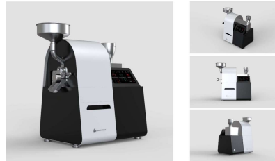
돌체비타 AI 커피로스팅기 - AI 프로파일로 최적의 커피원두 자동로스팅