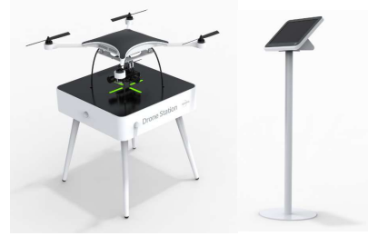
서플드론 스테이션 및 제어 키오스크 - 긴급 의약품 배송 등 드론 제어용 장비 SET