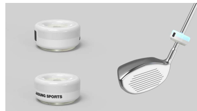
골프 스윙 연습기 - 골프 스윙 스피드에 맞춰 임팩트 타이밍과 스피드를 스스로 체크 및 교정