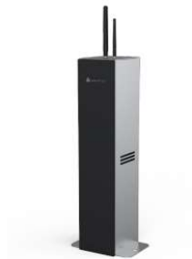
방수형 침수 감지 통보센서 - 침수 시 차량 진입 자동차단장치