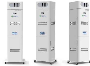
지능형 자동방역 시스템 (KAIST IT융합연구소 공동개발) - 자동 방역 필요성 판단 및 방역 분무 및 공기정화